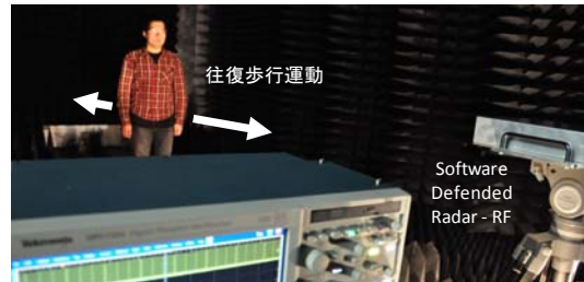
図2 人物運動検知実験概要